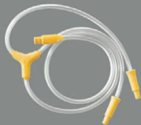
1 x slange